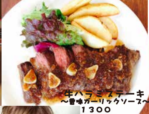
牛ハラミステーキ ～香味ガーリックソース～ 1300