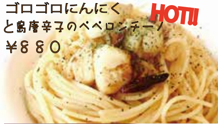
ゴロゴロにんにくと島唐辛子のベベロンチーノ HOT! ¥880