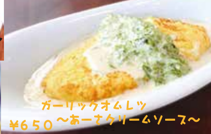
ガーリックオムレツ ¥650～あーまクリームソース～